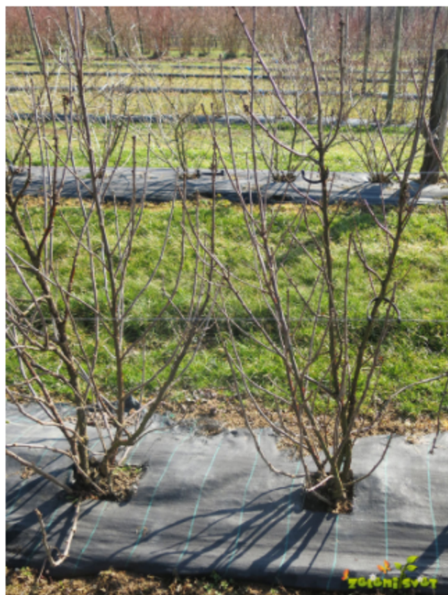
Grm ribeza PRED rezjo.

kakovostnih grozdov. Tudi na starejših poganjkih (kratki) z manjšimi jagodami. Kakovostni grozdi naj bodo dolgi z velikimi jagodami.