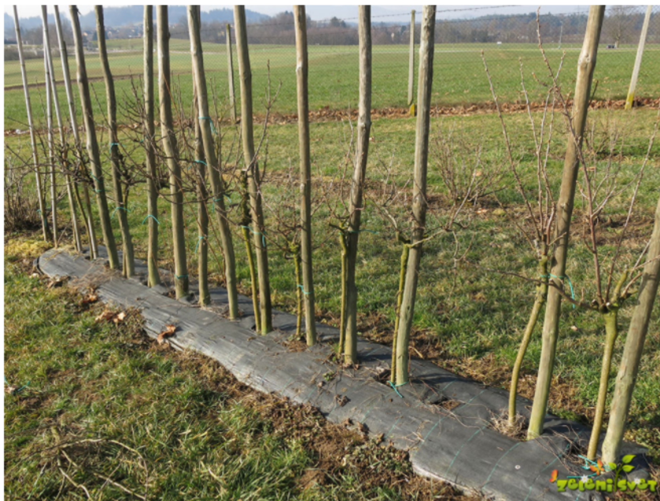
Rdeči in črni ribezi na deblu ob opori.

Vzgojne oblike na deblu so predvsem razširjene v vrtovih. Kot podlaga za cepljenje se pri rdečem in belem ribezu uporablja zlati ribez .