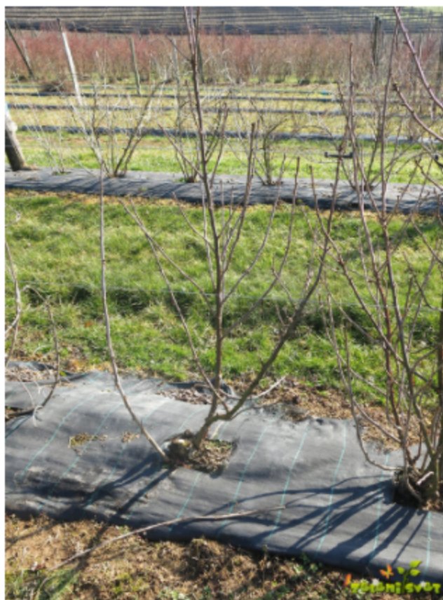
Grm ribeza PO rezi.

Enoletni poganjek še ni obraščen s stranskimi poganjki. Pri dvoletnem poganjku odstranimo vse stranske poganjke do višine 30 cm , da poganjki pod težo pridelka ne polehajo. Stranskih poganjkov pri tej gojitveni obliki ne krajšamo.