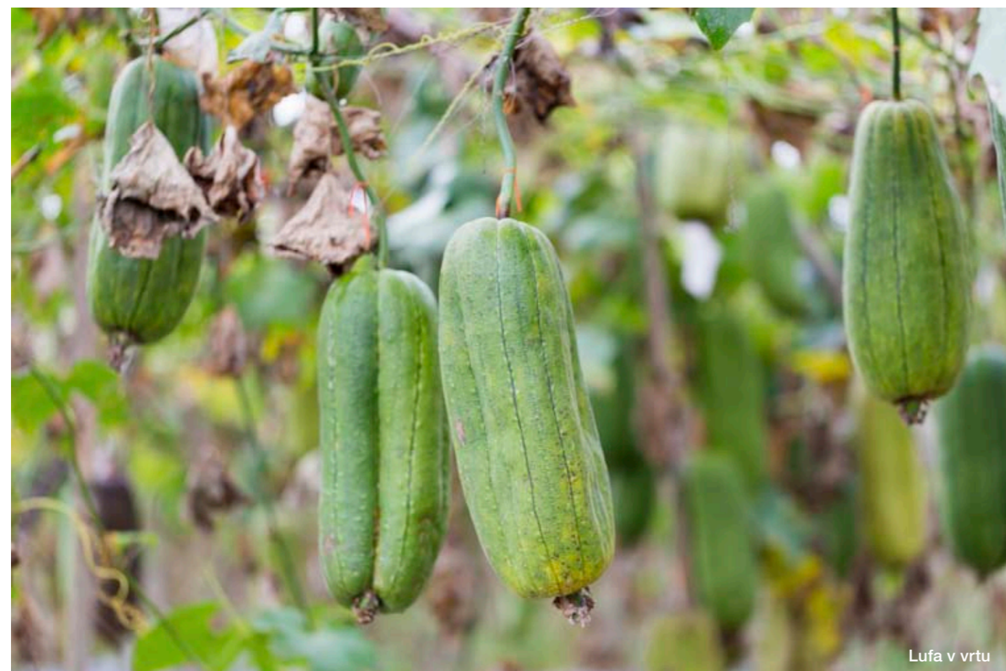
Lufa v vrtu

Skomine po sladkih sadežih z domačega balkona, terase ali vrta so vedno večje in zagotovo se nestrpnost sprašujete, katera rastlina bi bila taka, da bi rodila kar se da kmalu. Odgovor ponuja haskap jagoda ali užitno modro kosteničje. Njene okusne plodove bomo lahko trgali že v naju in juniju, tako pa bo v povprečju zorila kar tri tedne pred prvimi jagodami. Poleg nje predstavljamo še nekaj zgodnjih sort, ki bodo potolažile našo nestrpnost.