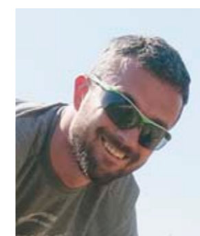
Besedilo: Davor Špehar, Zeleni svet

Skomine po sladkih sadežih z domačega balkona, terase ali vrta so vedno večje in zagotovo se nestrpnost sprašujete, katera rastlina bi bila taka, da bi rodila kar se da kmalu. Odgovor ponuja haskap jagoda ali užitno modro kosteničje. Njene okusne plodove bomo lahko trgali že v naju in juniju, tako pa bo v povprečju zorila kar tri tedne pred prvimi jagodami. Poleg nje predstavljamo še nekaj zgodnjih sort, ki bodo potolažile našo nestrpnost.