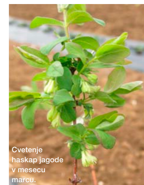
Cvetenje haskap jagode v mesecu marchu.

Plodove z nizkih grmov haskap jagode na balkonu ali terasi obiramo že v maju in juniju. Dejansko je to prvo sadje z domačega balkona ali terase. Plodovi so dvojne jagode, ki so temno modre barve, z značilno sivkasto voščeno prevleko – poprhom. Zaradi ugodne vitaminske in mineralne sestave jih imenujejo tudi jagode večne mladosti. Vsebujejo veliko provitamina A, vitaminov B, C, antocijanov, flavonoidov in antioksidantov. Bogate so z minerali, kot so kalij, natrij, kalcij, magnezij, fosfor. Plodovi vsebujejo antikancerogene sestavine, delujejo protialergijsko in protibakterijsko, blagodejno vplivajo na želodec, jetra, kožo in varujejo pred srčnimi obolenji. Njihov okus spominja na borovnice,