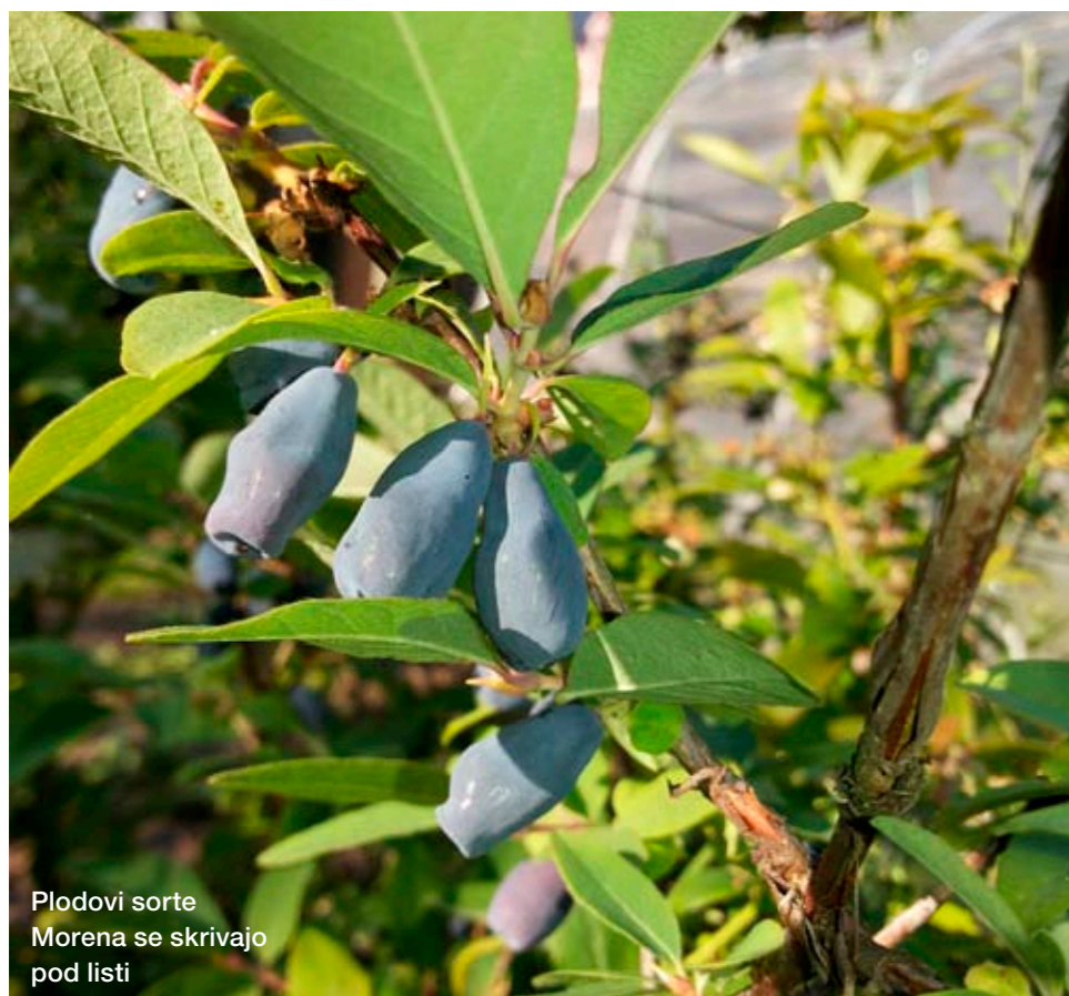
Plodovi sorte Morena se skrivajo pod listi