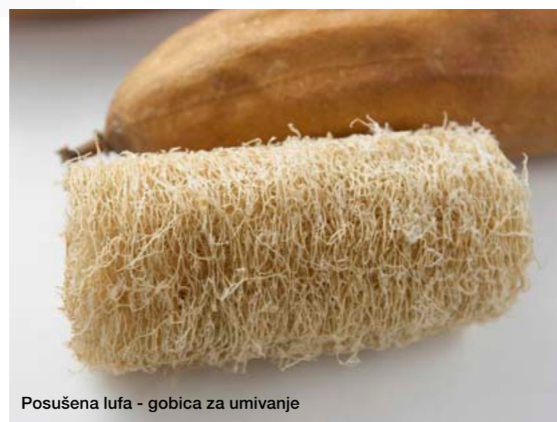
Posušena lufa - gobica za umivanje

Lufo v njeni domovini uporabljajo za zdravljenje in blaženje marsikaterih bolezni, med njimi tudi astme, bolezni kože in vranice, revmatizma, bolečin v hrbtu, zavira notranje krvavitve, bolečine v prsih, hemoroide, blaži izkašljevanje ... Tonik iz plodov se uporablja za zdravljenje kuge, sifilisa, tumorjev, bronhitisa in gobavosti. Z oljem iz semen pa zdravijo grižo, gobavost, vodenico, kronični bronhitis in vsa pljučna obolenja ter mrzlico in zlatenico. V Sloveniji jo uporabljamo predvsem v cvetličarske namene ali za ekološke krpice.