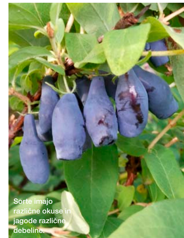
Sorte imajo različne okuse in jagode različne debeline.

Haskap jagoda ali užito modro kosteniče je popolnoma prezimna vrsta, ki vzdrži ekstremno nizke temperature (do minus 45 °C) in jo tudi čez zimo pustimo na balkonu ali terasi. Rada ima organsko zastirko nad območjem korenin (tudi v loncu, koritu) in namakanje v sušnem obdobju. Za gnojenje uporabimo sadjarska gnojila ali gnojila za jagodičje v priporočenih odmerkih. Prvič gnojimo marca, drugi odmerek pa dodamo po obiranju. V času cvetenja vzdržijo cvetovi do minus 10 °C. Vrsta ni samooplodna. Sadimo več različnih sort, da se medsebojno oprášijo. Uspeva v navadni vrtni zemlji, zato ni treba pripravljati kislega rastišča kakor pri ameriških borovnicah. Rada ima odcedna in vlažna tla. Zbitih ilovnatih tal s stoječo vodo ne prenese. Priporočamo sajenje triletnih sadik, ki za pokušino rodijo tekoče leto.