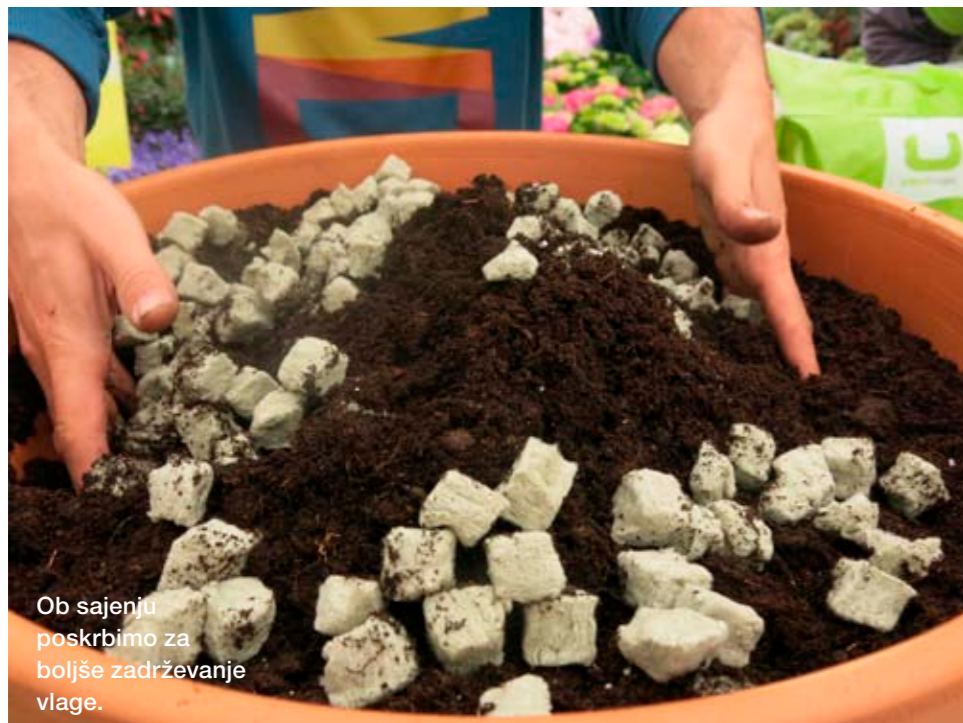
Ob sajenju poskrbimo za boljše zadrževanje vlage.